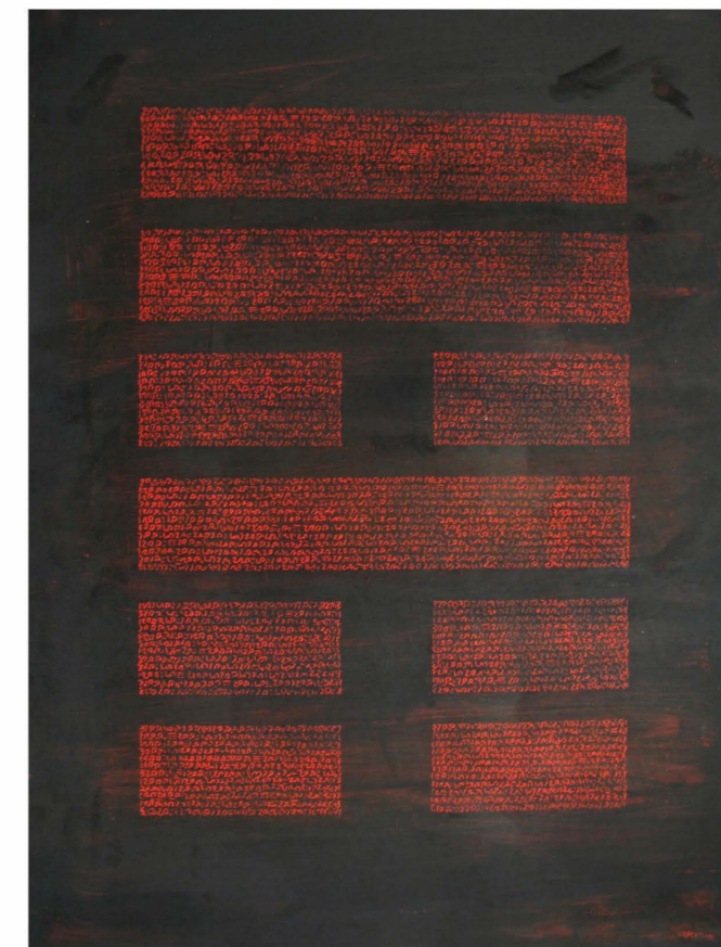
Hexagramme 53 Le développement